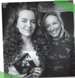
Rosa en Mel